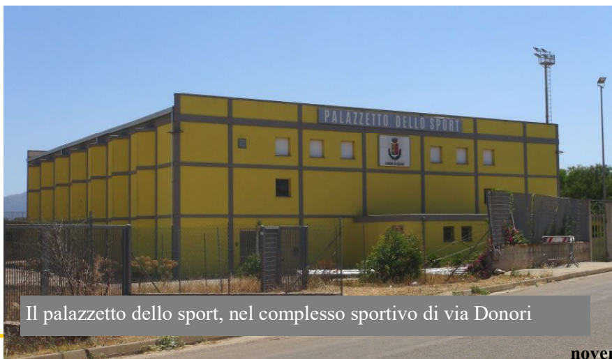
Il palazzetto dello sport, nel complesso sportivo di via Donori