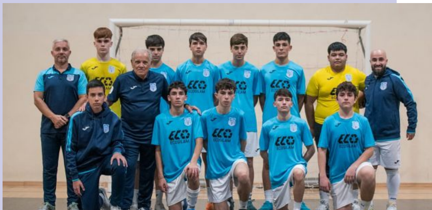
La formazione giovanile del San Sebastiano Under 17/19